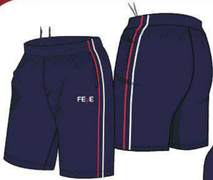
PANTALÓN CORTO CHÁNDAL

*Zapatillas de deporte blancas con velcro.